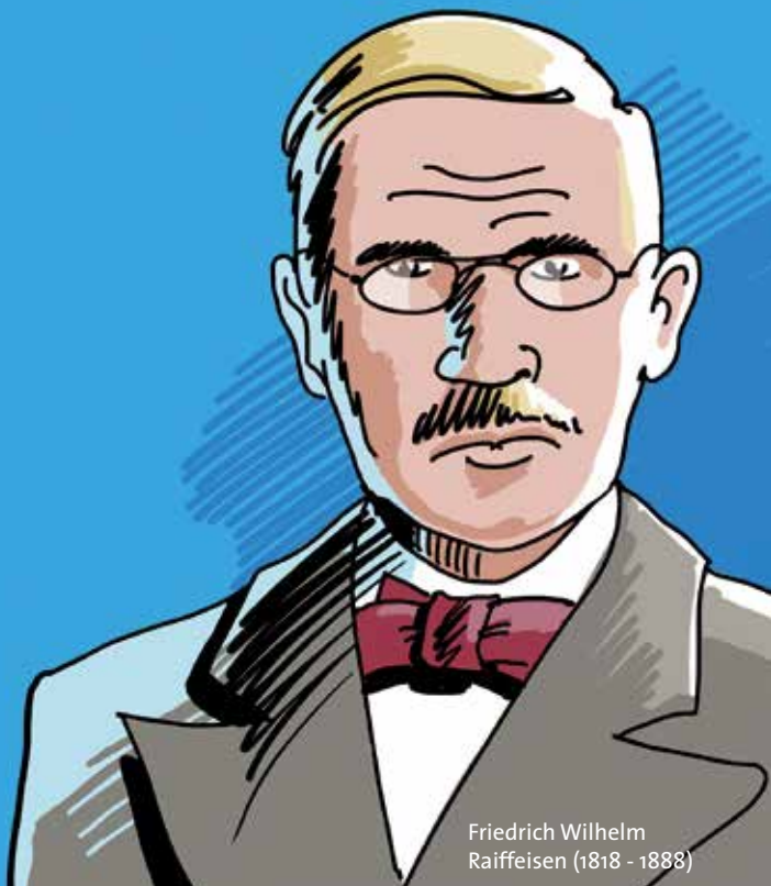
Friedrich Wilhelm Raiffeisen (1818 - 1888)